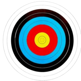
TF 122 cm RING 10

Target Face yang digunakan adalah berbahan MMT Spanduk